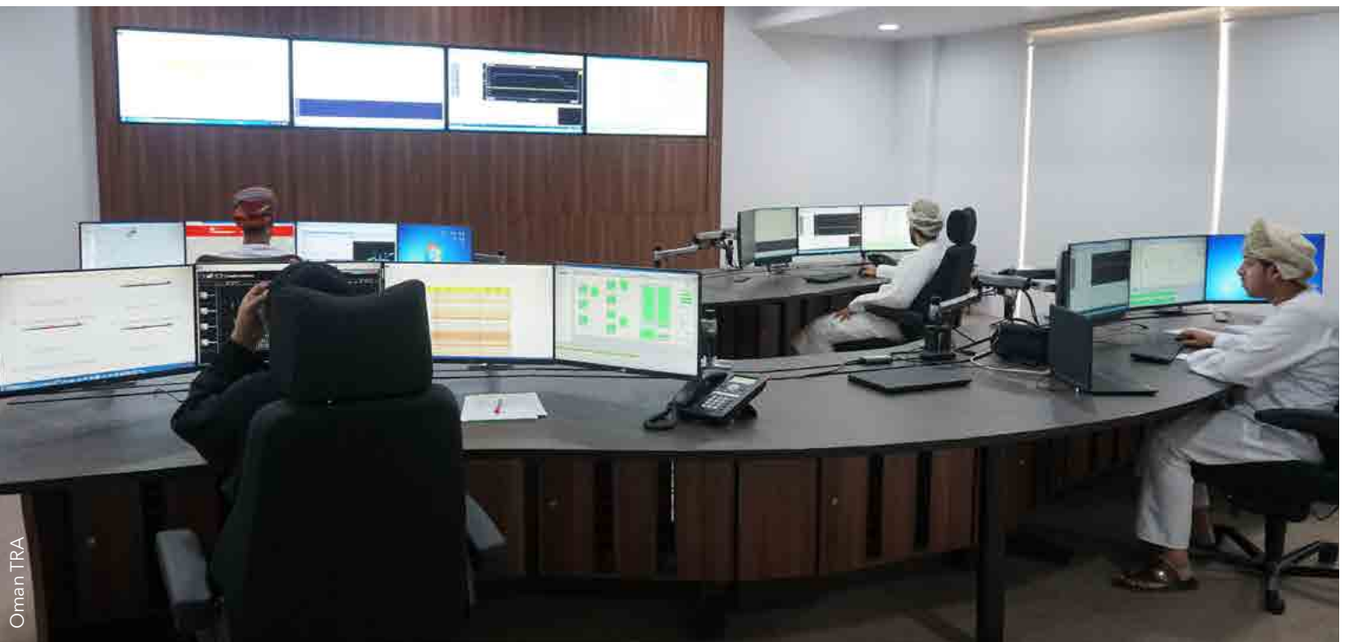
Centro de control de la estación de comprobación técnica de señales radioeléctricas espaciales situado en Mascate (Omán)

No hace falta ser científico para comprender que los retos mencionados supra requerirán inversiones considerables por parte de las administraciones nacionales, en términos tanto de infraestructura como de conocimientos.