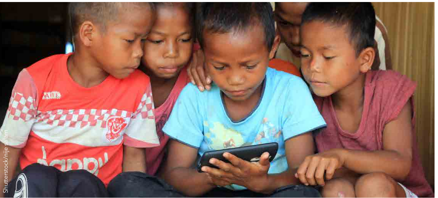
La WiFi de 28 GHz por satélite conecta ahora a millones de personas que viven en centros y poblaciones tanto urbanas como rurales.