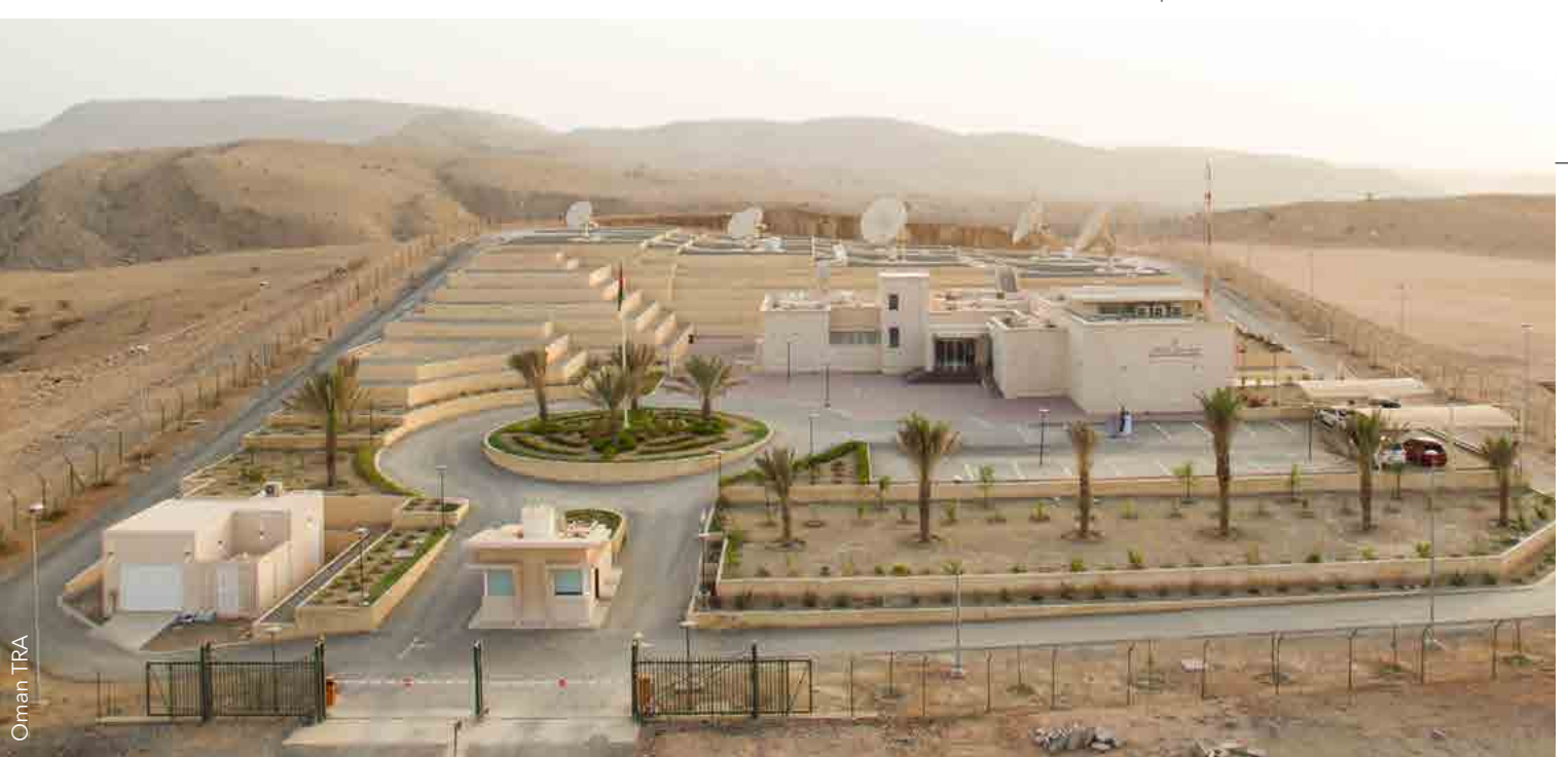
Estación de comprobación técnica de señales radioeléctricas espaciales situada en Mascate (Omán)

Las administraciones habrán de cooperar a un nuevo nivel, con objeto de consolidar la recopilación y el análisis de los datos y facilitar la correlación entre acontecimientos similares en lados opuestos del planeta y la predicción de eventualidades futuras.