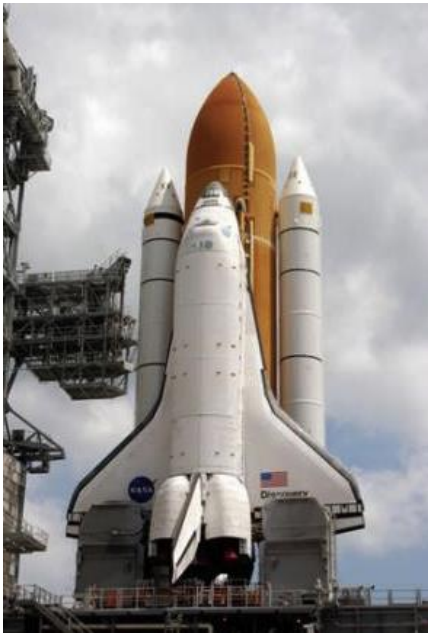
Transbordador espacial “Discovery” de la NASA

que su forma de despegue corresponde a la misma de los cohetes, con la diferencia de que debido a su estructura de avión, tiene la posibilidad de volver a la tierra, lo que le permite realizar diversos viajes. En su estructura, consta de un orbitador, que es en efecto la nave que pretende desplazarse en el espacio ultraterrestre, (en la foto aquella estructura que parece un avión). También cuenta con aceleradores, que son los cohetes que propulsan el orbitador fuera de la atmósfera terrestre (en la foto aquellos cilindros a cada lado de la nave).