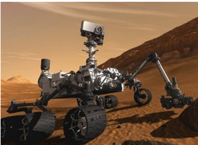
Sonda Espacial "Curiosity"

Las sondas espaciales son objetos enviados al espacio con el propósito de realizar estudios sobre cuerpos celestes. Estos estudios pueden realizarse por medio del aterrizaje de la sonda en el cuerpo celeste o simplemente orbitando al rededor del mismo. Estas son manipuladas por el hombre en tierra y los datos que se obtienen también son enviados a las estaciones en tierra, ya que las sondas nunca son tripuladas.