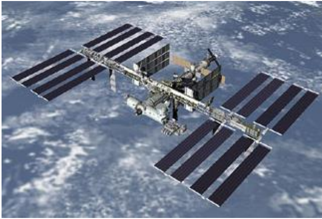
Estación Espacial Internacional

diversas nacionalidades unidos por el propósito de realizar contribuciones científicas. Se puede afirmar que la Estación Espacial Internacional es un laboratorio en el espacio ultraterrestre.